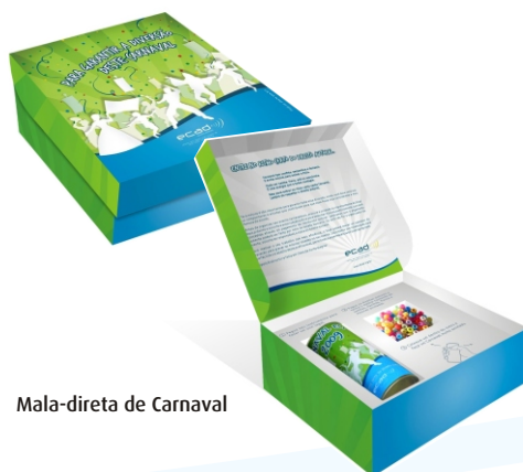
Mala-direta de Carnaval

O tema da campanha deste ano foi "Para garantir sua diversão neste Carnaval, entre no ritmo certo do direito autoral". Para a mala-direta foi criada uma caixinha contendo um tubo especial e miçangas para que, após a realização do pagamento do direito autoral pelo usuário de música, as miçangas fossem colocadas dentro do tubo, que se transformava num instrumento musical com som semelhante a um chocalho.